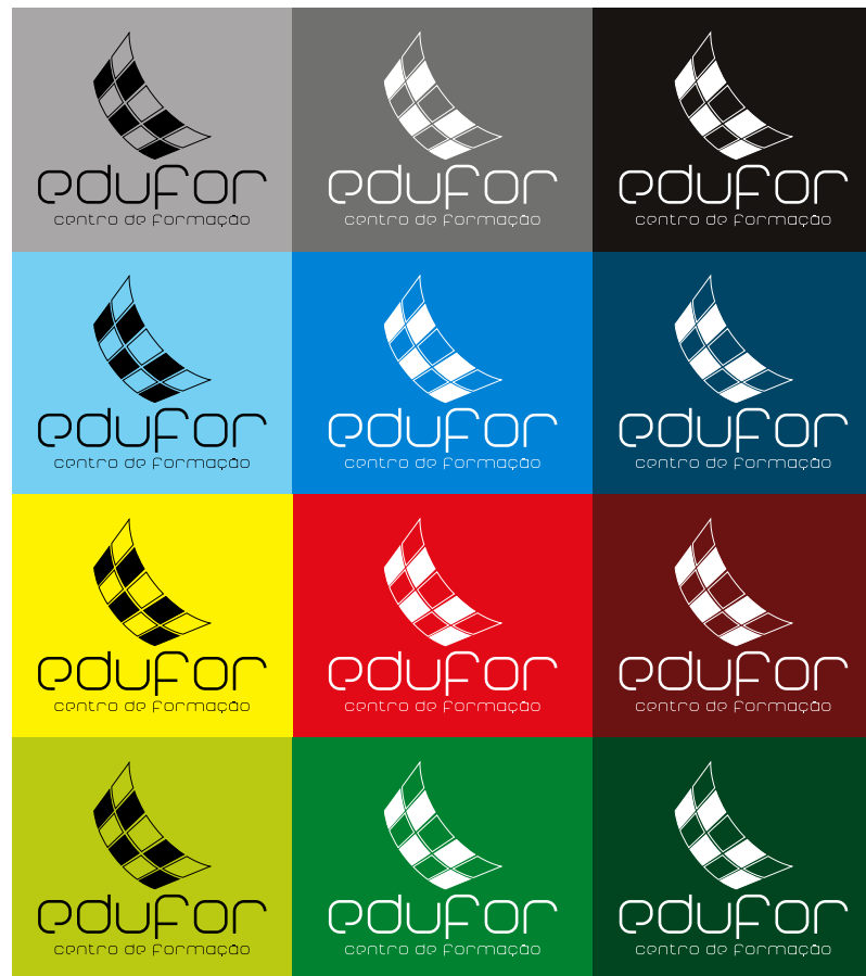
Logótipo sobre várias cores.