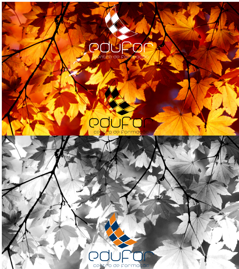
Logótipo sobre imagens a cores e a preto branco.