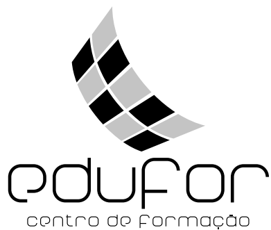
Logótipo em escala de cinzentos.