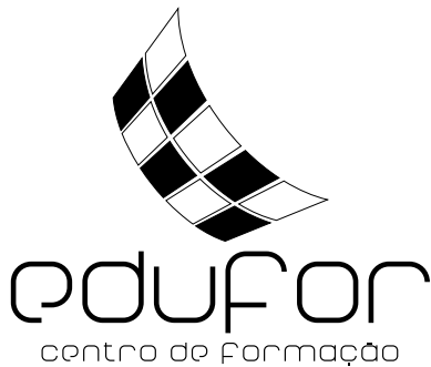
Logótipo preto e branco.