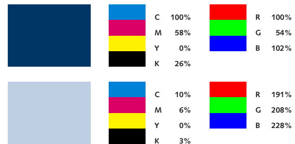
Cores do logótipo mono-cromático.