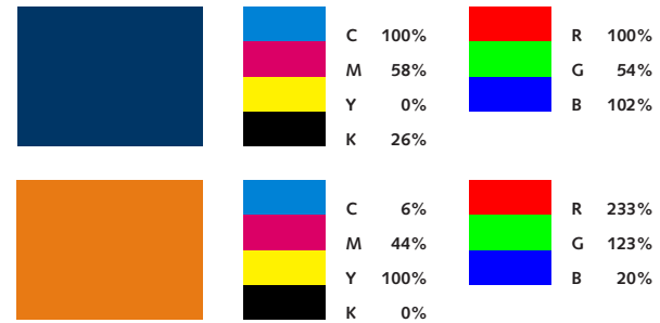
Cores do logótipo oficial.