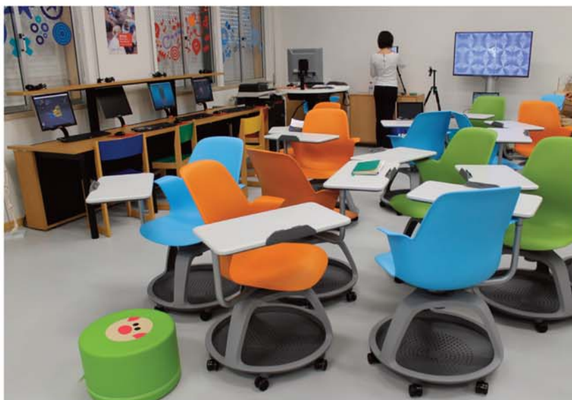
Espaço está repleto de materiais inovadores, desde as cadeiras aos quadros

Escola Secundária de Mangualde apresentou ontem novo espaço educacional, pioneiro nas regiões Centro e Norte. A sala de aula do futuro promove a interacção com as novas tecnologias e pretende ser uma mais-valia na formação de alunos e professores e na aplicação de novas metodologias Página 7