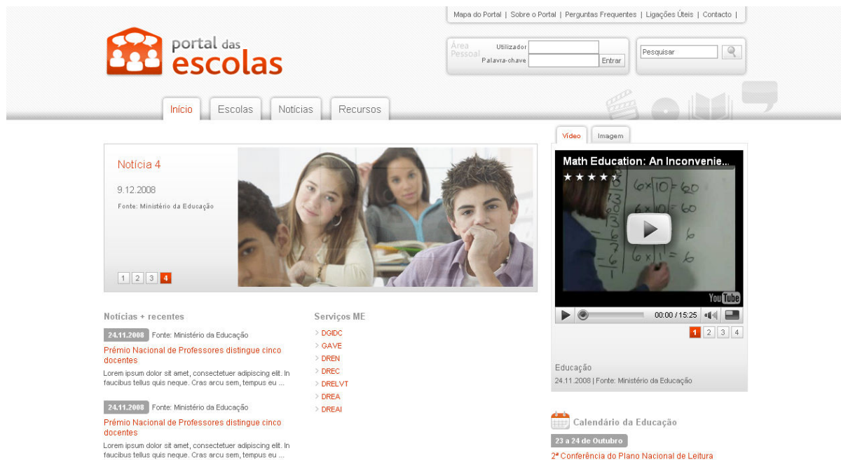
Figura 8 – Página de autenticação

O docente deve autenticar-se no Portal das Escolas ( https://www.portaldasescolas.pt ) e seleccionar o separador “Certificação”.