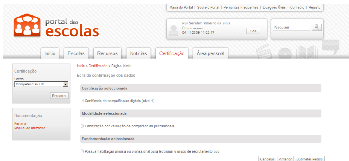
Figura 13 – Validação da informação

Depois de seleccionadas as opções relacionadas com o nível, modalidade e fundamentação da certificação, será apresentada uma página com o resumo da informação anteriormente seleccionada, permitindo, assim, efectuar uma validação da informação antes de submeter o pedido de requerimento. No caso de estar tudo correcto, o utilizador deverá premir o botão “submeter pedido”. No caso de não estar tudo correcto, deverá premir o botão “anterior”, podendo assim efectuar a rectificação da informação desejada.