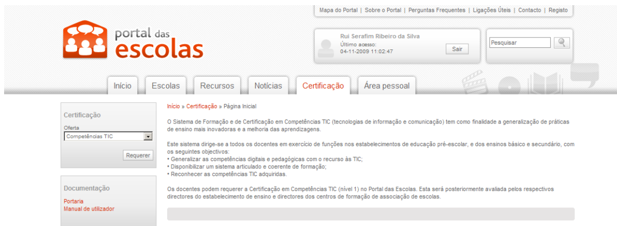
Figura 9 – Selecção da certificação em “Competências TIC”

Após ter sido efectuada a autenticação no Portal das Escolas, o docente deverá seleccionar o separador “Certificação”, seleccionar a oferta de certificação em “Competências TIC” e premir o botão “Requerer”.