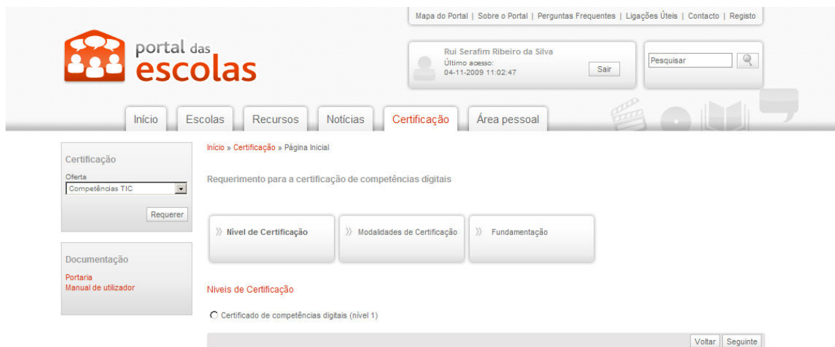
Figura 10 – Selecção do nível de certificação

Seleccionada a certificação pretendida, o docente terá de seleccionar o nível de certificação pretendido e premir o botão “Seguinte”.